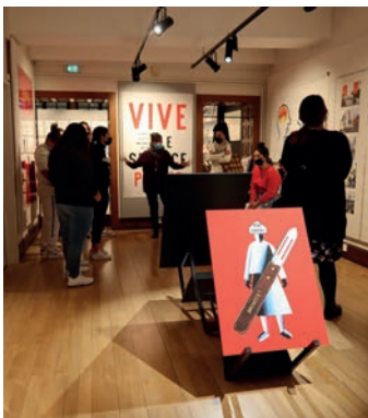
Visite d'exposition au Musée de l'Imprimerie et de la Communication Graphique

La charte est un levier pour réinterroger les frontières entre les territoires de la ville, entre le in situ et le hors-les-murs. Par son application, les signataires pourront développer des projets avec des habitant.e.s de quartiers prioritaires en dehors de ces quartiers, accompagner la mobilité entre le centre et ces quartiers et faire venir les habitant.e.s des quartiers prioritaires dans leurs lieux, en leur offrant des conditions d'accueil favorables.