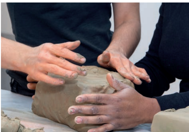
PasserElles Buissonnières», projet du maLYON

La coopération témoigne de la prise en considération des interdépendances au sein du secteur culturel, et plus largement entre la culture et les autres secteurs dans lesquels interviennent les politiques publiques.