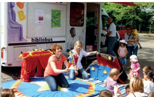
Bibliobus circus à Ménival