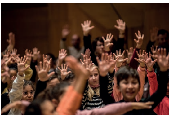
Démos (Dispositif d'éducation musicale et orchestrale à vocation sociale) à l'Auditorium-Orchestre national de Lyon

Les institutions et lieux culturels ont vu leur relation au public bouleversée par l'essor des nouvelles pratiques liées au numérique, bouleversement amplifié et accéléré par les confinements et fermetures d'établissements culturels lors de la pandémie de Covid-19. Ces nouvelles pratiques ont déplacé les questions de démocratisation culturelle vers des enjeux de démocratie culturelle.