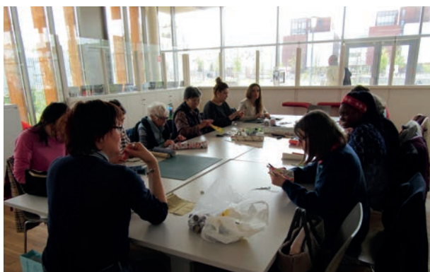
« C'est moi qui l'ai fait ! » atelier de la BM avec le public FLE © BM Lyon

La coopération s'impose dans la définition des politiques culturelles au niveau des territoires pris dans l'imbrication des collectivités, avec un objectif d'atténuer les effets parfois clivants des entités administratives.