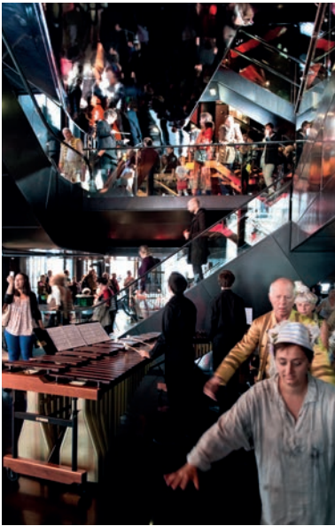
L'Opera Nell'opera, Opéra de Lyon