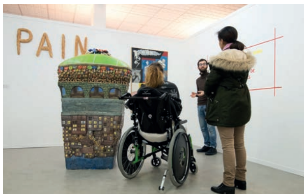
"Peintures buissonnières", exposition du macLYON à l'Hôpital Henry-Gabrielle

Les signataires de la chartre mettent en œuvre des projets d'intervention dans les lieux empêchés tels que les lieux de privation de liberté ou les hôpitaux.