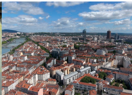
Vue aérienne de la Guillotière