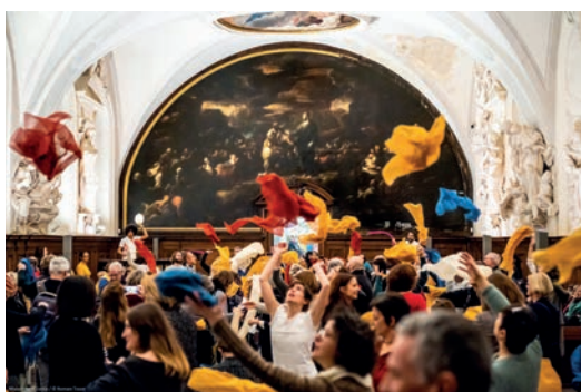
Nocturne drapé au Musée des beaux-arts avec la Maison de la danse

La Ville de Lyon, à travers la démarche des « 100 villes climatiquement neutres » en 2030 détaillée en annexe, accompagnera l'ensemble des signataires de la charte afin de poursuivre et accentuer les pratiques en matière d'éco-responsabilité.