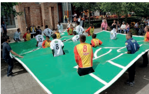
Projet performance avec l'AS Duchère au maCLYON

Cet engagement vise à permettre à chaque personne d'accéder, de contribuer et de participer de façon égale aux disciplines et métiers artistiques, culturels et patrimoniaux afin de développer son plein potentiel et concourir au développement durable, social et inclusif de la cité.