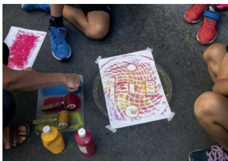
Visite atelier Typostreet proposé par le Musée de l'imprimerie

Les habitant.e.s et personnes, concerné.e.s par les projets, sont associé.e.s aux propositions culturelles et sont considéré.e.s comme partenaires des projets.