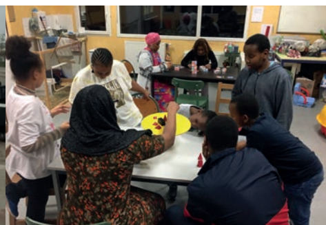
Soirée jeux au CHRS Armée du Salut avec la BM Lyon