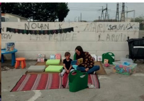
Atelier de la BM Lyon pour l'aire Accueil Voyageurs Lyon7