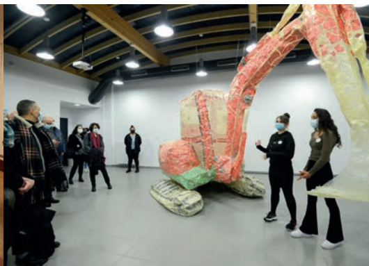
Vue de l'exposition au Collège Mermoz - Œuvres de la collection du maCLYON