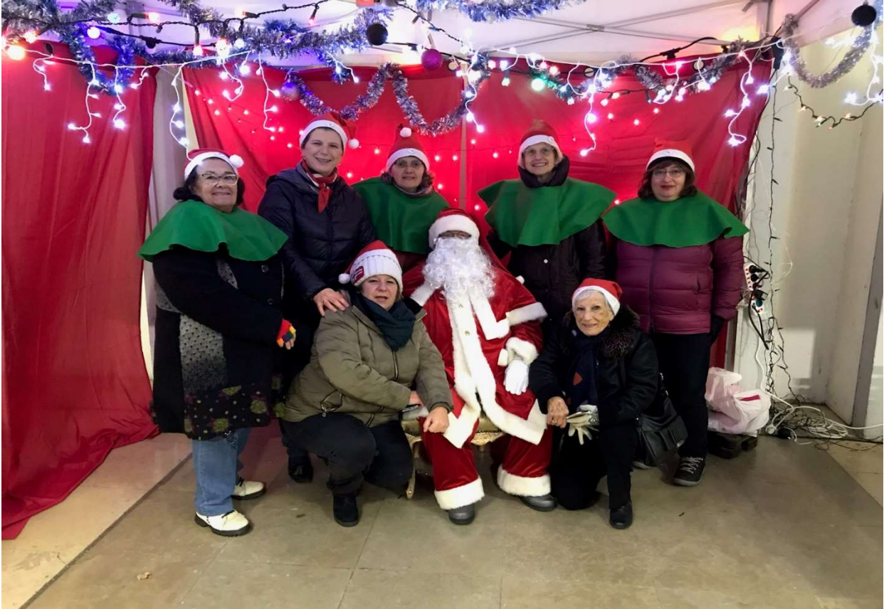
Un Cœur pour le Père Noel

Grâce à eux et par le dévouement de nos membres, ce fut chaleureux, joyeux, festif !