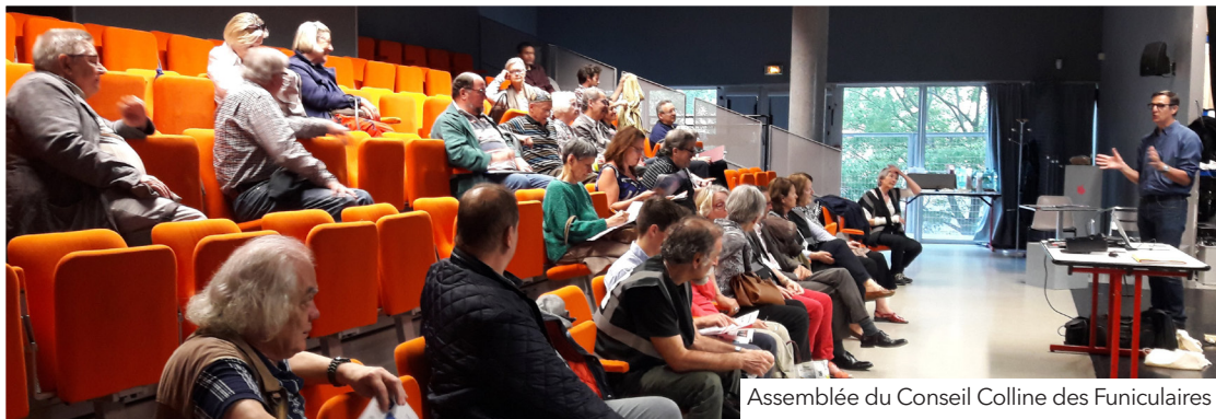
Assemblée du Conseil Colline des Funiculaires