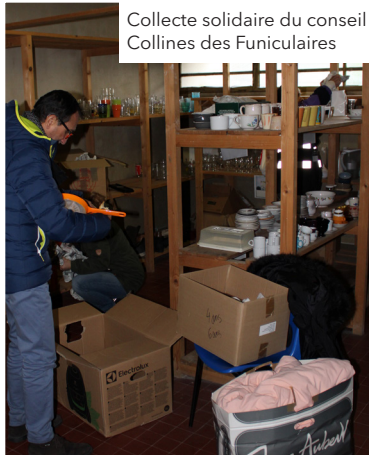
Collecte solidaire du conseil Collines des Funiculaires

De nombreux projets ont déjà vu le jour au sein des différents conseils de quartier du 5 e !