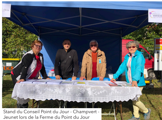
Stand du Conseil Point du Jour - Champvert - Jeunet lors de la Ferme du Point du Jour