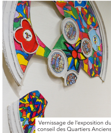
Vernissage de l'exposition du conseil des Quartiers Anciens