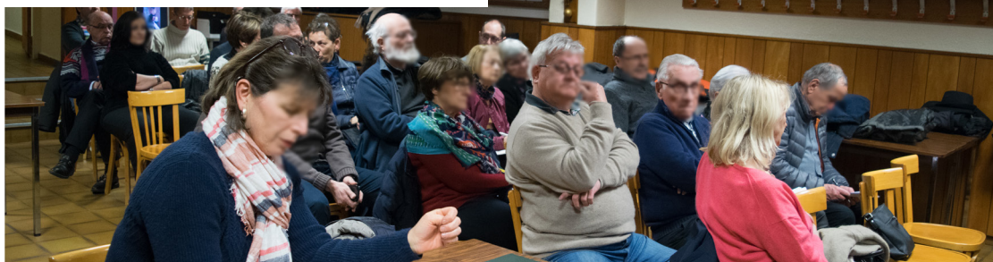
Assemblée du Conseil Point du Jour - Champvert - Jeunet

Le conseil de quartier est un acteur majeur de la démocratie locale. Par son intermédiaire, les habitants·es sont consulté·es sur les projets d'aménagements urbains. C'est une reconnaissance de leur expertise d'usage. De plus, les citoyens·nes disposent d'une enveloppe annuelle pour améliorer leur environnement quotidien.