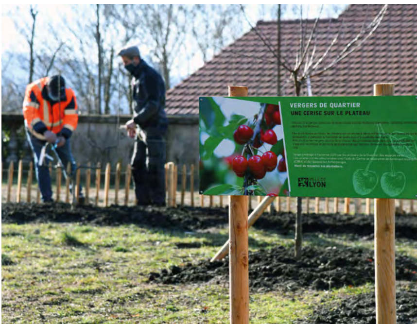
Plantation d'un verger de quartier au parc Chazière (4 e arrondissement)

FLÉCHÉS SUR DES PRODUITS DE QUALITÉ ET DURABLES (AOP, AOC, AB, CONVERSION AB...) EN 2026.