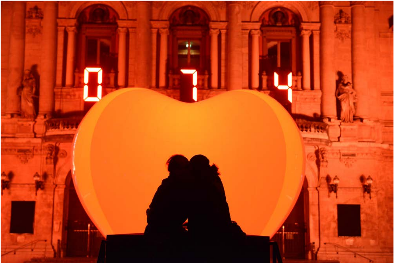
Coup de Coeur - Franck Pelletier, Les Allumeurs Place des Célestins - 2016