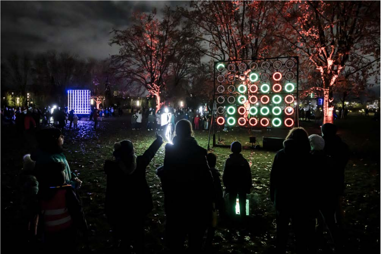
Games of Light - Groupe LAPS Parc Blandan - 2021