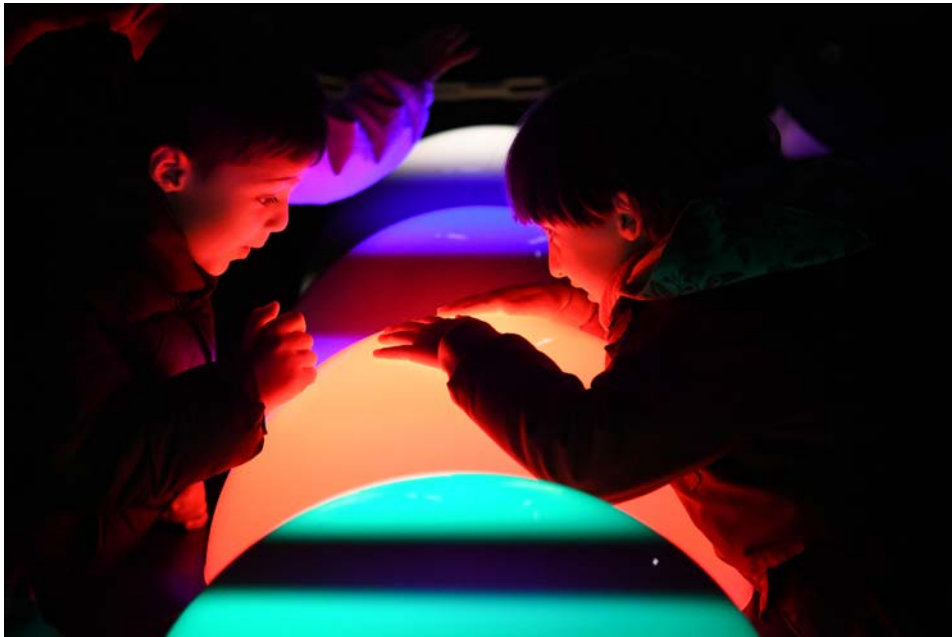
Games of Light - Groupe LAPS Parc Blandan - 2021