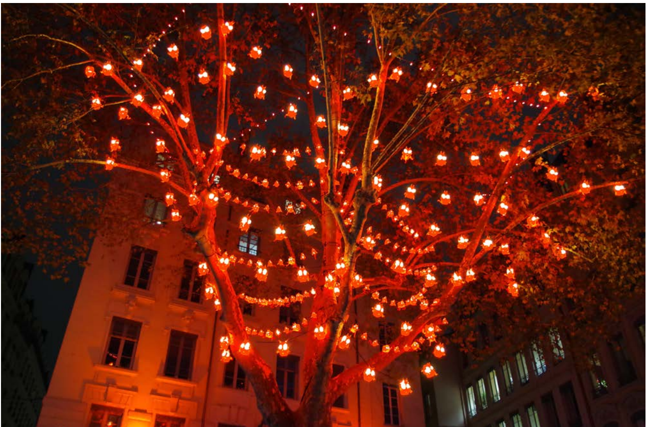
L'enfer de Bibi, c'est ici - BIBI Place Antoine Rivoire - 2016